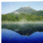
〒889-4492 宮崎県高岡町大字西原999番地 / TEL: (0984) 42-2111 / e-mail: machi@town.takaharu.lg.jp

火の国熊本「きよらの郷」。パリエーションに富んだ露天風呂が楽しい「黒川温泉」が有名。温泉町独特の風情を存分に味わえる。「オキチモズク」「金比羅杉」など天然記念物もあり、広々とした高原と澄んだ筑後川の源流を中心に、大自然を楽しめる。