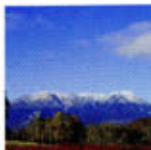
〒397-8588 長野県木曾郡木曾町福島2326番地6 / TEL: (0264) 22-4287 / e-mail: seisaku@town.kiso.net

天孫降臨(神々の舞降りた地)の地として名高い霧島連峰の「高千穂峰」。山麓にある「御池」周辺は全国でも数少ない環境省指定の「野鳥の森」があり、多くの野鳥が飛来。狭野神楽と蔵川神楽は、33番ある舞の随所に「真剣」が使用され、その舞は勇壮である。