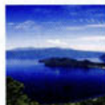
〒017-0292 秋田県内子郡小坂町小坂町山ノ内730-1 / TEL: (0182) 47-3402 / e-mail: sosome@vill.higashitaro.akita.jp

魚梁瀬杉で有名な「木の里」。藩政時代から「育てながら伐る」という理念で手厚く管理されてきた森林は樹齢200年から300年、直径2m高さ50mにおよぶ大木の森林である。柚子栽培も盛んで馬路村柚子の産地としても知られる。安田川の鮎釣りや川遊びも楽しい。