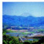
〒046-0592 北海道余市郡赤井川村赤井川74-2 / TEL: (0135) 34-6211 / e-mail: info@akajigawa.com

「丘のまちなみ」。白一色に覆われた神秘的な冬。新緑が輝く春。農作物の彩りがきれいな夏。空高く紅葉が美しい秋。春夏秋冬それぞれに、豊かな表情を見せてくれる素晴らしいパノラマは、もうドラマやCMなどでもお馴染み。いつでも、絶景の丘を存分に味わえる。