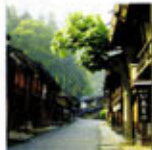
〒399-5301 長野県木曾郡南木曾町高津3668番地 / TEL: (0264) 57-2001 / e-mail: info@town.nagio.nagano.jp

信州伊那谷を南北に蛇行する天竜川(天の中川)を挟み、リンゴ、梨、桃、ぶどう等の果樹園や水田が広がる農村村。棚田や茅葺民家、春の桜や秋の紅葉など自然と調和した古き良き日本の原風景が広がる。陣馬形山頂からの中央・南アルプスの眺望も見事。