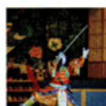
〒399-3502 長野県下伊那郡大鹿村大鹿354 / TEL: (0265) 39-2001 / e-mail: iki_zabai@vill.oshika.nagano.jp

世界遺産白川郷の合掌造り集落。ドイツの建築家ブルーノ・タウト氏が昭和10年に絶賛した合掌造りの家屋が建ち並ぶ美しい農村集落で、世界的に有名。豊かな森林と田んぼに囲まれ、冬は雪で白く覆われるその姿は、まさに日本の原風景。海外からの観光客も急増中。