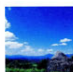
〒869-2402 熊本県阿蘇郡小国町志高町43 / TEL: (0967) 42-1111 / e-mail: info@town.minamitagami.kumamoto.jp

いっきゅうと彩の里は、一年中、日本の料理を彩る町。春は梅、桃、桜が爛漫に、夏は鮎とあめごの両女王が清流を賑わせ、秋の駿川内溪谷は紅葉で名高い。また、等高線を描く標高の棚田は絶景。古き良き日本の風景と極上の湯を、心身のすべてで満喫する。