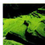
〒771-4501 徳島県勝浦郡上勝町大字福原字下福原3-1 / TEL: (0885) 46-0111 / e-mail: webmaster@kamikatsu.jp

南アルプス山麓に位置する山間の村。春は3000本の桜、夏はヒマラヤの青いケシの花、標高差の生み出す爽快な紅葉と、山々を真っ白に塗り替える白銀の冬…。四季を通じて美しいこの村は、江戸の昔から伝わる大鹿歌舞伎でも有名。