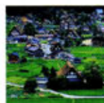
〒051-5692 岐阜県大野郡白川村鳴谷517 / TEL: (0576) 6-1311 / e-mail: tandoku@shirakawa.go.jp

最上川舟遊の中継地として栄えた大蔵村。冬には日本一大きな雪だるまで有名。霧びた湯治場の風情を残す肘折温泉郷。山菜やきのこなど滋味豊かな料理を提供します。山間に広がる四ヶ村の棚田は日本棚田百選のひとつ。夏にははたはる火が幻想的な世界を醸し出す。