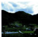
〒509-2612 岐阜県下呂市馬瀬名丸406 / TEL: (0576) 47-2111 / e-mail: shimin@city.gero.lg.jp

北海道知床の東の玄関口、根室海峡に面する。品質日本一を誇る秋鮭などの漁業と、知床連山の裾野に広がる酪農。日本で初めて実現した忠類川のサーモンフィッシング、ポー川史跡自然公園や標津湿原など、手つかずの自然がそこにある。