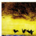
〒085-1203 北海道阿寒郡鶴居村鶴居西丁111番地 / TEL: (0154) 64-2112 / e-mail: tanchou@vill.tsurui.lg.jp

水質のよい馬瀬川は鮎の釣り場としてつとに有名。瀬や淵、巨岩などの多様な変化と四季を彩る沿岸の景観が魅力的。周辺の山並み、農地、民家、そして馬瀬川がつくる静かな佇まいの美脚の里には、残したい日本の原風景がある。