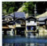
〒626-0493 京都府与謝郡伊根町伊根51番地 / TEL: (0772) 32-0504 / e-mail: info@town.inc.kyoto.jp

中山道「妻籠宿」で有名。江戸時代の面影を色濃く残すこの宿町は、年間60万人もの来客がある。国の重要文化財「桃介橋」周辺は天白公園として整備されており歴史の里としての魅力は高い。また、木地師の里はろくろ細工の伝統を伝える貴重な文化財を持つ。