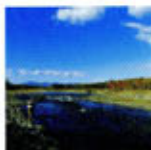
〒086-1632 北海道標津郡標津町北2条西1-1-3 / TEL: (0153) 82-2131 / e-mail: kikaku@shibetsuon.jp

どっしりと雄大にそびえる御獄山の麓に広がる木曾町開田高原。雄大な自然が融合した美しい農村景観が広がり、希少な在来種「木曾馬」がのびのびと暮らす日本のふるさと。また、全国ブランドの「開田そば」や「御獄はくさい」、「すんき漬」でも有名。