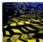
〒996-0212 山形県最上郡大蔵村大字清水2528 / TEL: (0233) 75-2324 / e-mail: info@vill.hokura.yamagata.jp

山々に囲まれた「カルデラの里」には、豊かな自然と数多くの動植物が息しています。清流余市川にはヤマベやアユが遊び、雄大な自然を活かした「キロロリゾート」は観光客の笑顔であふれ、緑の大地では牛の群れがゆったりと草をはむ。純農村の風景がここに。