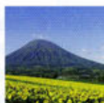
〒044-0801 北海道北斗郡京極町京極527番地 / TEL: (0136) 42-2111 / e-mail: kikaku@town.kyogoku.jp

特別天然記念物クンショウの生息地であることからその名がつけられた。クンショウの姿が人間の生活に溶け込んでいる姿は貴重。釧路湿原国立公園は日本一大大きく、湿原そのものが天然記念物に指定されている。酪農もさかん。誰もが悪い描く北海道の酪農風景そのもの。