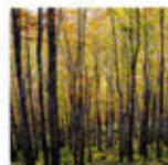
〒019-0801 秋田県雄勝郡東成瀬村大字内子字人下30-1 / TEL: (0182) 47-3402 / e-mail: sosome@vill.higashitaro.akita.jp

十和田八幡平国立公園に属し、国の特別名勝及び天然記念物にも指定されている十和田湖の西岸に位置する小坂町。重要文化財に指定された「小坂鉱山事務所」や明治の芝居小屋「康楽館」、登録文化財である「天使館」や「小坂鉱山病院記念棟」など歴史的建造物でも有名。